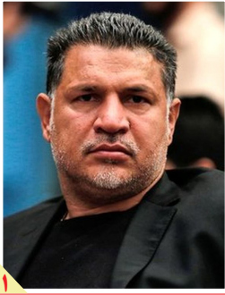
واکنش علی دایی به حوادث اخیر پیرامون خود: