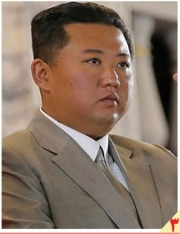
پیونگ یانگ دو موشک بالستیک کوتاهبرد را آزمایش کرد

روزنامه سیاسی، اقتصادی، اجتماعی و فرهنگی صبح ایران