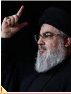
دوستاناران ایران غمگین نباشندا