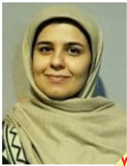
برای ساخت تئاتر عروسی مکان دائمی نداریم

با حکم مقام معظم رهبری اعضای دوره جدید منصوب شدند