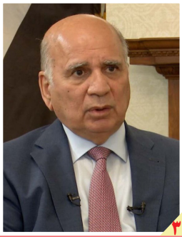
یکی از محورهای سفر فواد حسین؛ وزیر خارجه عراق به ایران

روزنامه سیاسی، اقتصادی، اجتماعی و فرهنگی صبح ایران