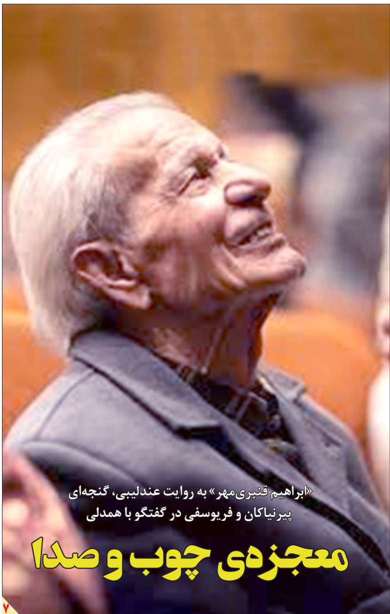
«ابراهیم قنبری مهر» به روایت عنددلیبی، کنجهای بیرنیاکان و فریوسفی در گفتگو با همدلی

ارزیابی سعید جباریان از عملکرد برخی از سخنرانان جنجالی