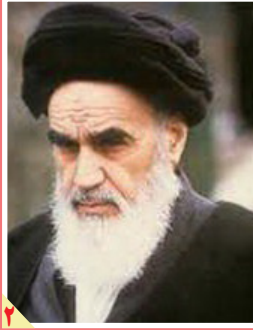
بایگه خبری جماران خبر داد: