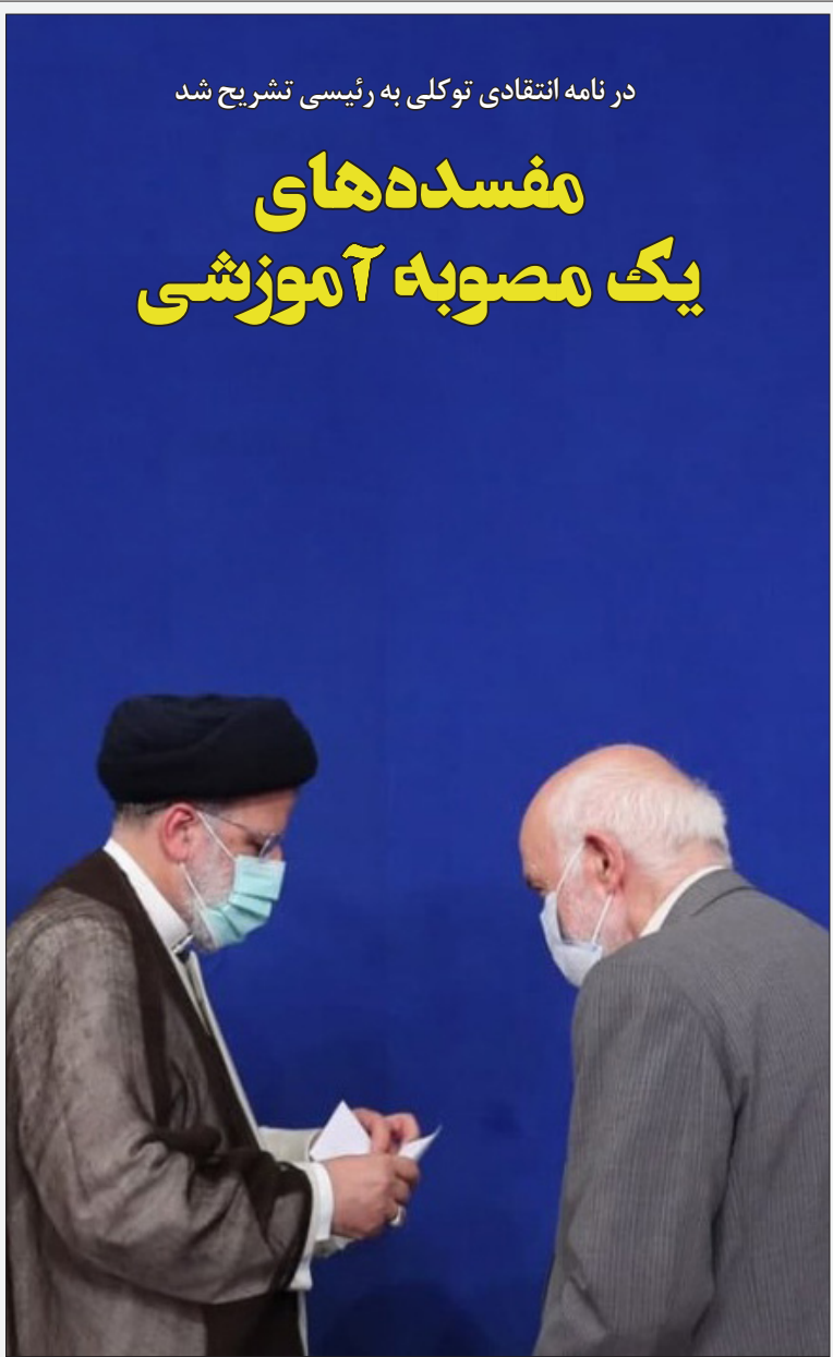
در نامه انتقادی توکل به رئیسی تشریح شد