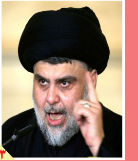
اختلاف بر سر نامزدی محمد شیاع السودانی برای نخست‌وزیری عراق