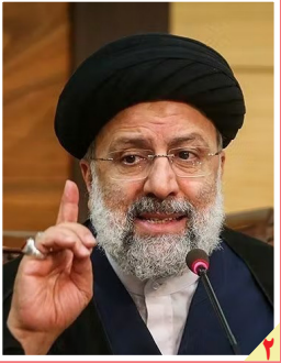
در میان جدال‌های اخیر دولت مدعی امر به معروف شد:

روزنامه سیاسی، اقتصادی، اجتماعی و فرهنگی صبح ایران