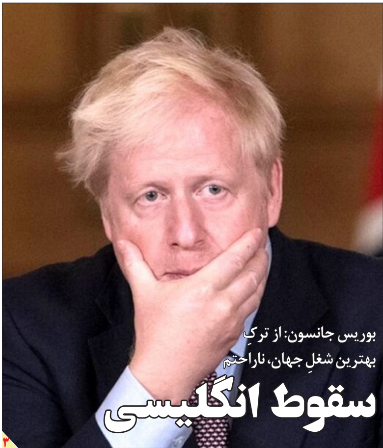
بوریس جانسون: از ترک بهترین شغل جهان، ناراحتیم