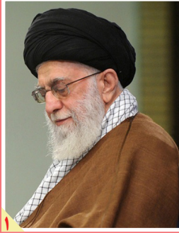
رهبر انقلاب در پیام به حجاج ناکید کردند: