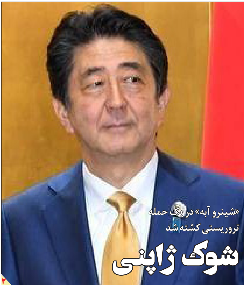
«شینزو آبه» در پیگ حمله ترور یستی کشته شد