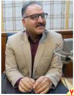
گفت‌وگوی همدلی با استاد «بهزاد نقاش»

روزنامه سیاسی، اقتصادی، اجتماعی و فرهنگی صبح ایران