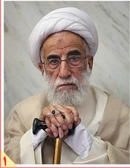
آیت‌الله جنتی در دیدار اعضای کمیسیون اقتصادی مجلس: