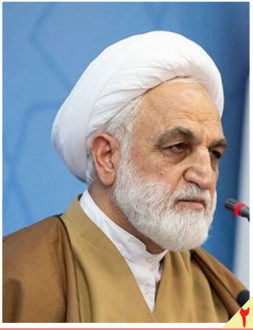
دستور رئیس قوه قضاییه برای برخورد با اخلاف گران مراسم ارتحال امام؛

روزنامه سیاسی، اقتصادی، اجتماعی و فرهنگی صبح ایران