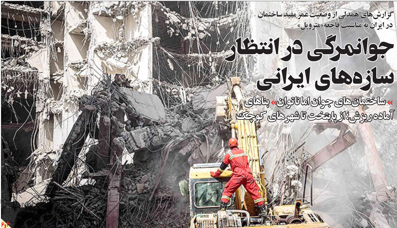
گزارش‌های همدلی از وضعیت عمر مفید ساختمان در ایران به مناسبت فاجعه «متروپل»