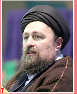
توصیه سید حسن خمینی: در مراسم از تحال اسراف و زیاده‌روی تکثیر

دوشنبه ۹ خرداد ۱۴۰۱ - ۲۸ شوال ۱۴۴۳ - ۳۰ مه ۲۰۲۲