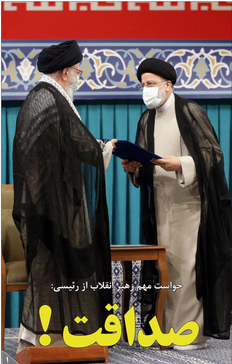
خواست مهم رهبر انقلاب از رئیسی: