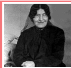
چهره زنانه مشروطیت

روزنامه سیاسی، اقتصادی و فرهنگی صبح ایران