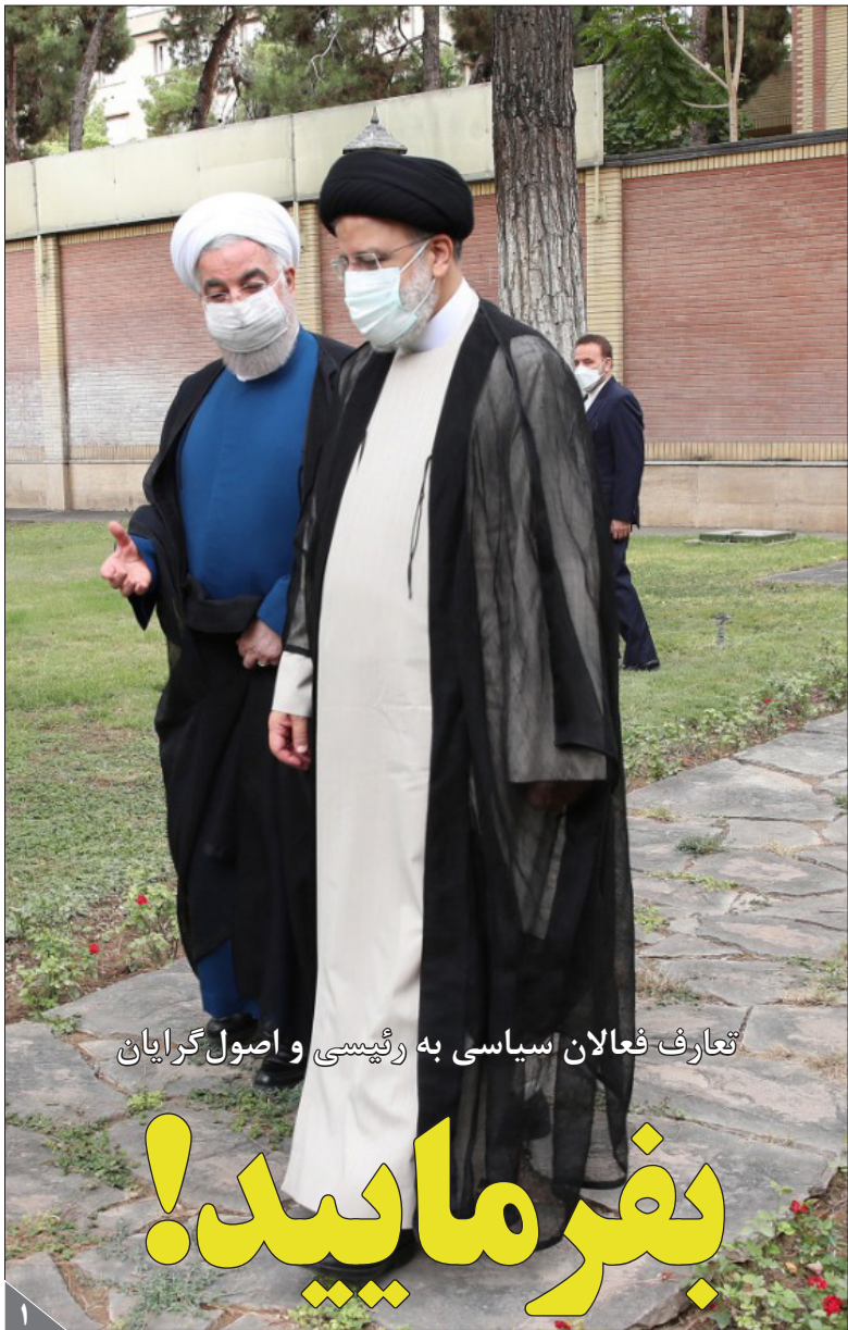
تعارف فعالان سیاسی به رئیسی و اصول‌گرایان