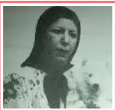
«قمر» نماد در موسیقی زنان