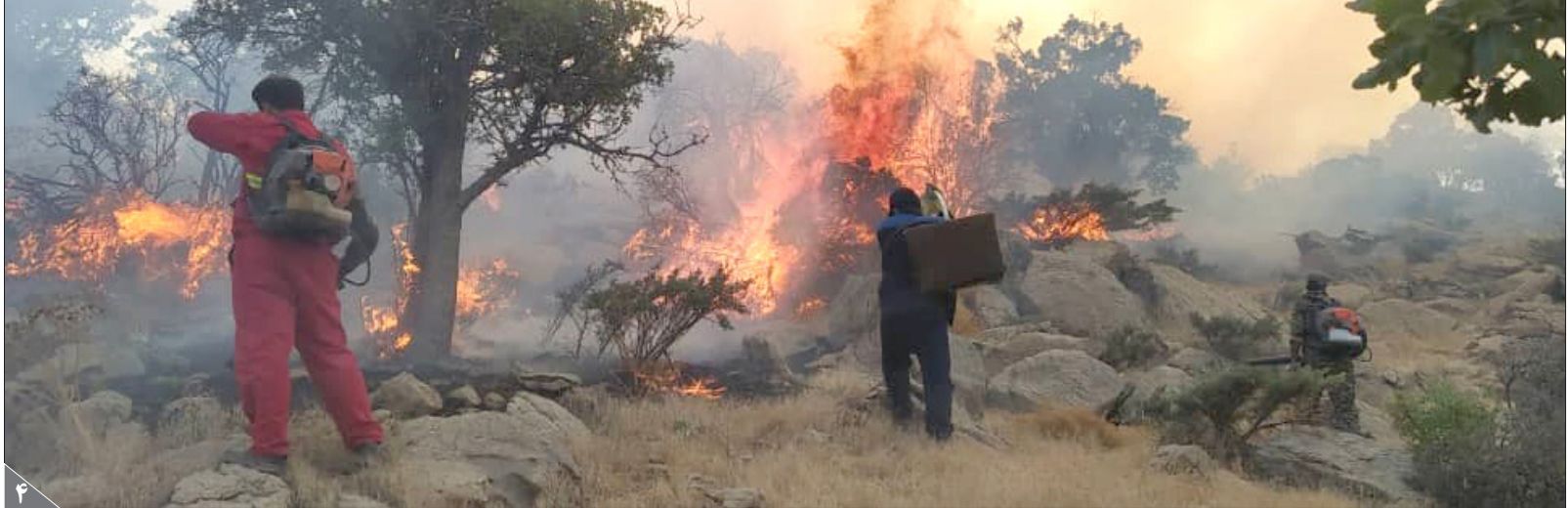
کسب آتش پیکنو