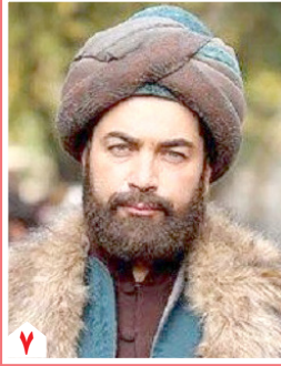
واکنش تند حسن فتحی به حواشی جدید «مست عشق»