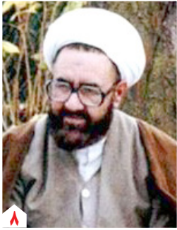
سالروز شهادت آیت‌الله مطهری