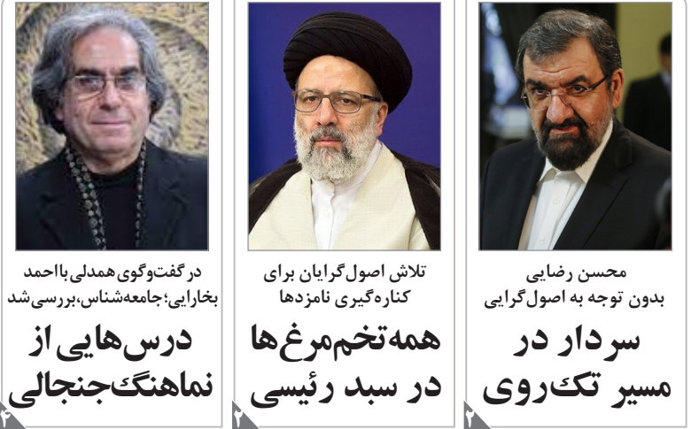
در گفت‌وگو با همدلی با احمد بخارایی؛ جامعه‌شناس، بررسی شد

آیت‌الله سید علی سیستانی، مرجع صاحب نام شیعیان، روز گذشته در نجف اشرف از پاپ فرانسیس اول، رهبر کاتولیک‌های جهان استقبال کرد و پس از پایان این دیدار، پاپ شهر نجف را ترک کرد. در پایان این دیدار دفتر این دو مقام مذهبی جهان با انتشار اطلاعیه‌هایی به ذکر جزئیاتی از این ملاقات تاریخی پرداختند. این دیدار با هدف تعمیق