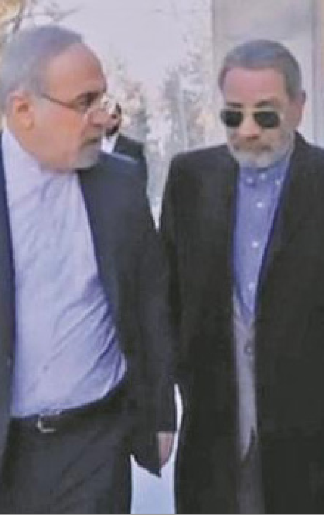
در گفت‌وگو با همدلی با احمد بخارایی؛ جامعه‌شناس، بررسی شد

طی دو اطلاعیه جزئیات دیدار پاپ و آیت‌الله سیستانی تشریح شد: