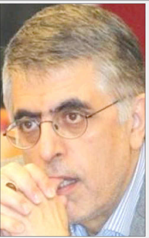
روایت غلامحسین کرباسچی از عملکرد مجلس یازدهم: