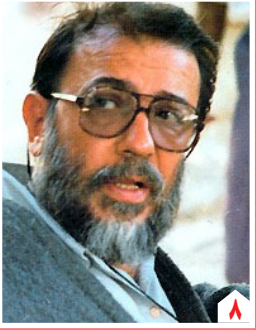
به مناسبت سالروز درگذشت علی حاتمی

روزنامه سیاسی، اقتصادی، اجتماعی و فرهنگی صبح ایران