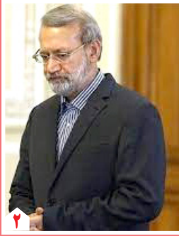
واگذاری امور توافقنامه چین به دولت روسی