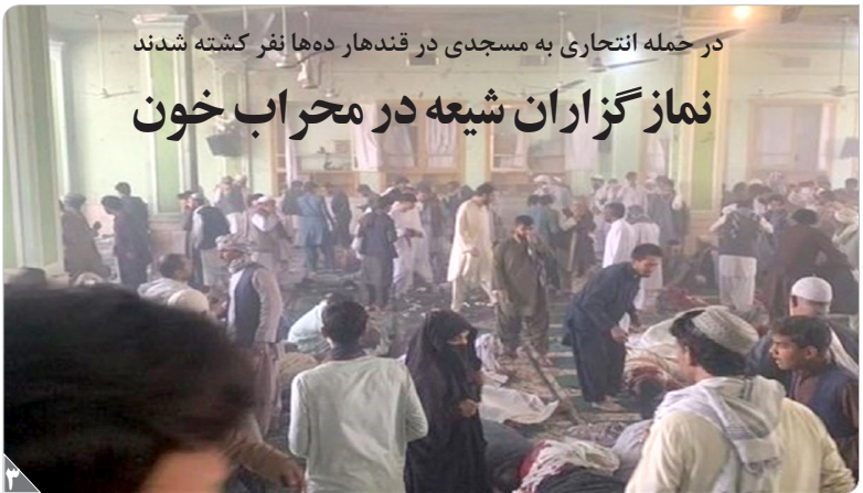
در حمله انتحاری به مسجدی در قندهار ده‌ها نفر کشته شدند

هدملی: در روزهایی که مسیر دریافت مجوز پلتفرم‌های آنلاین یا هر کسب‌وکار دیگری مثل دریافت مجوز تأسیس داروخانه، پیچیده‌تر شده، گزارش‌ها از مالکیت هزاران داروخانه توسط مقامات دولتی حکایت دارد. آن‌طور که گزارش‌های رسیده از دیوان محاسبات نشان می‌دهد، در حالی هزار مقام دولتی جمهوری اسلامی، مالک داروخانه‌های کل کشور هستند که از این جمع، فقط ۲۲۱ داروخانه توسط کاندیدان شاغل در پست‌های حاکمیتی، سیاست‌گذاری، صدور مجوز و نظارت بر امور دارو اداره می‌شوند.