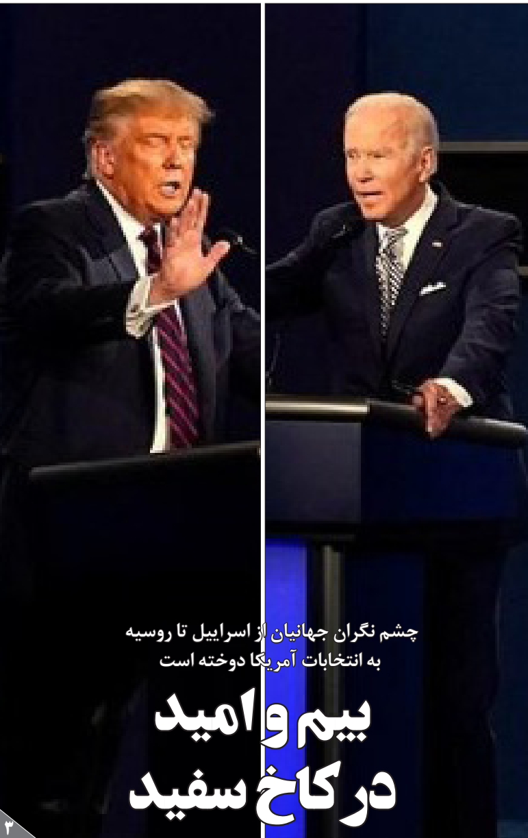
چشم‌نگران جهانیان از اسرائیل تا روسیه به انتخابات آمریکا دوخته است