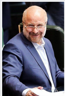
تحرکات اجرایی رئیس قوه قانونگذاری

به بالای ۳۰۰ نفر در روز رسید و آمار موارد جدید ابتلا به این ویروس کشنده از ۶ هزار نفر در یک روز گذشت. آمارهایی که حالا تعدادی از کارشناسان با صراحت بیشتری درباره صحت‌وسقم آن صحبت می‌کنند. درحالی‌که مدتی قبل ایرج حریرچی، معاونت وزارت بهداشت در یک برنامه تلویزیونی گفته بود دو برابر شدن آمارهای اعلام شده به عدد واقعی موارد ابتلا و مرگ نزدیک‌تر است. روز گذشته عضو شورای عالی نظام پزشکی اعلام کرد «تعداد جان‌باختگان کرونا ۳ الی ۴ برابر آمارهای رسمی است.»