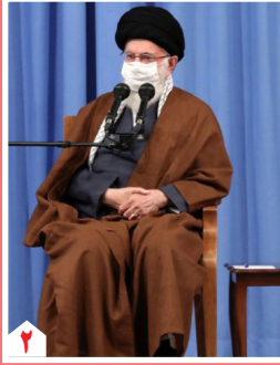
در دیدار اعضای ستاد ملی مقابله با کرونا