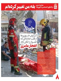
به بهانه انتشار «خوزی‌ها» در استان خوزستان

روزنامه سیاسی، اقتصادی، اجتماعی و فرهنگی صبح ایران