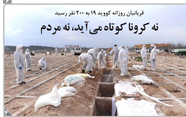
عباس: تهران، خرداد، خوشگل مقدم

همدلی | ممنوعیت واردات گوشی تلفن همراه بالاتر از ۳۰۰ یورو لغو شد». این آخرین اتفاق خبرساز در مهم‌ترین بازارهای موبایل پایتخت بود که دیروز در صدر اخبار رسانه‌ها جای گرفت. یک روز بعد از این که سخنگوی انجمن واردکنندگان موبایل خبر ممنوعیت واردات تلفن همراه بالای ۳۰۰ یورو را رسانه‌ای کرد و انفجار دیگری در قیمت این کالای اساسی ایجاد شد، وزارت صنعت، معدن و تجارت اعلام کرد که هیچ گونه تغییری در رویه واردات گوشی تلفن همراه بالاتر