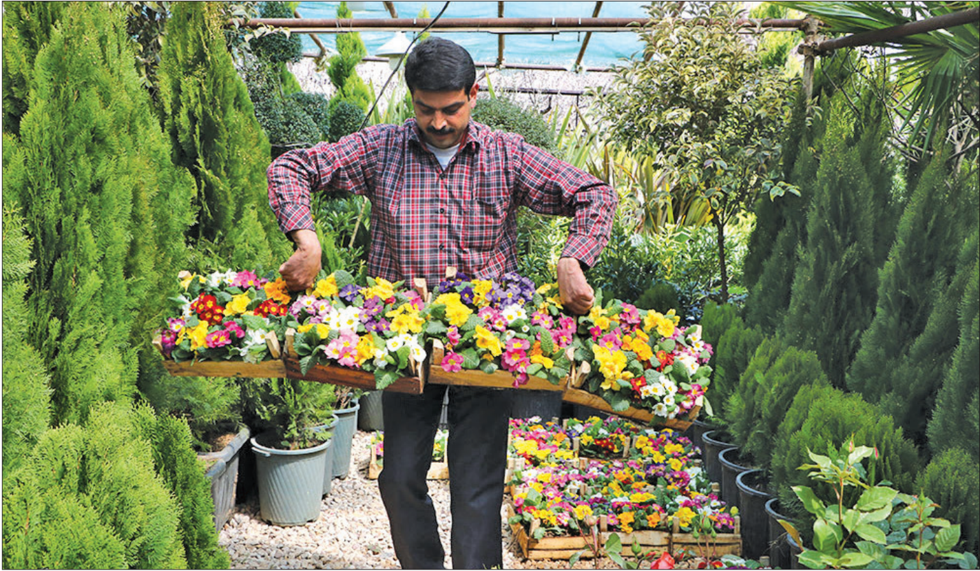
بازار بهاره در شهر شیراز، مردم ایران برای استقبال از بهار و عید نوروز، با خرید شب عید خود را آماده نوروز، این سنت زیبای ایرانی در آستانه ورود به سال ۱۳۹۸ می‌کنند.