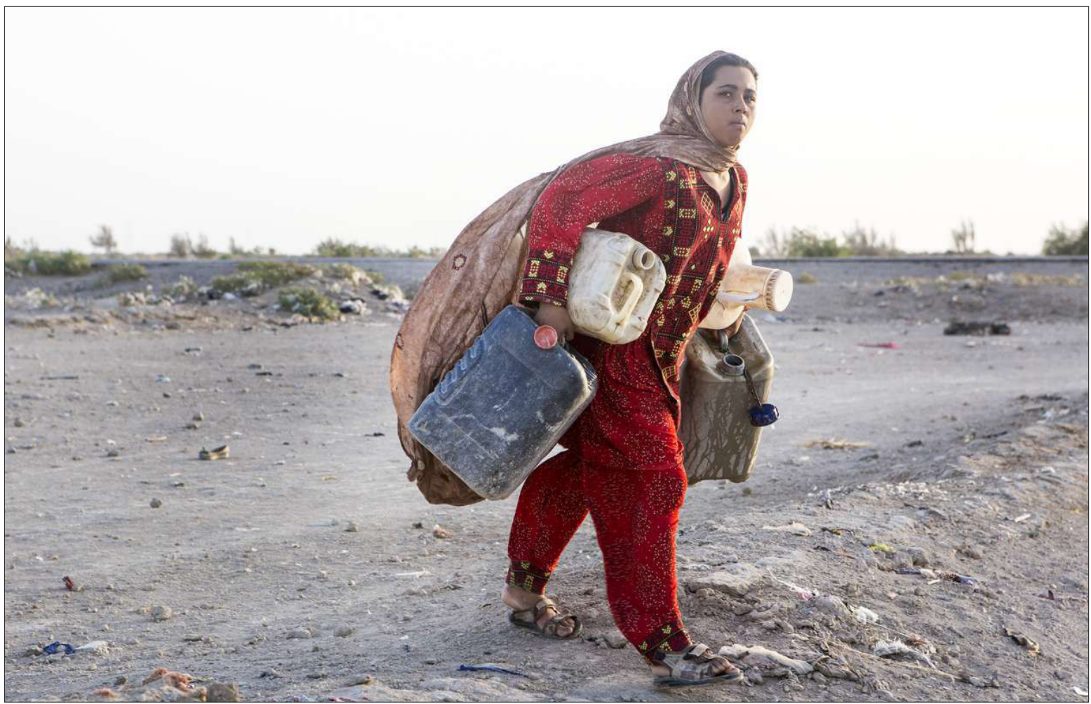
بسیاری از روستاهای اطراف زابل در بحران شدید کم آبی به سر می‌برند. مردم این مناطق می‌توانند روزانه به مدت ۴ الی ۵ ساعت از تنها لوله اصلی آب استفاده کنند