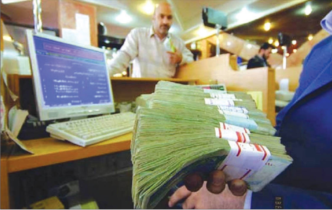
بانک‌ها در پی سود بانکی بیشتر، نرخ سود بانکی را افزایش داده‌اند.