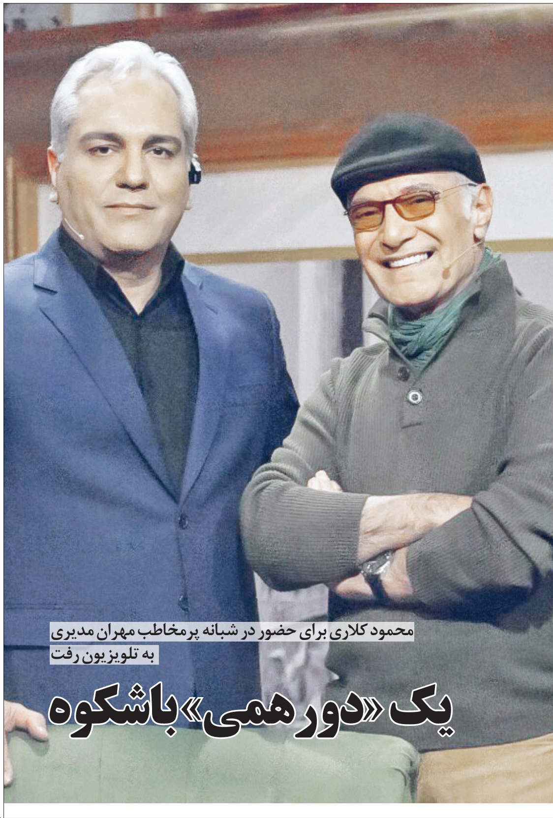
محمود کلاری برای حضور در شبانه پرمخاطب مهران مدیری به تلویزیون رفت

۴- بحران آلودگی هوا و آثار زیانبار آن در حالی این ملت و کشور را در باتلاق خود گرفتار ساخته است که منشأ آلودگی هوا در تهران و کلانشهرهای ایران توسط دهها مرکز علمی و پژوهشی روشن و تبیین شده است و در صورت مساله و شناخت علل و عوامل آلودگی هوا، ابهامی وجود ندارد. براساس گزارش شرکت کنترل کیفیت هوای شهرداری تهران و سایر مراکز علمی کشور «طی سال‌های اخیر، آلاینده اصلی شهر تهران که موجب فرارگری و وضعیت هوا در شرایط ناسالم بوده است، ذرات معلق با قطر کمتر از ۲/۵ میکرون بوده است و منابع آلاینده اصلی شهر تهران در دو دسته «منابع متحرک» (به ترتیب میزان آلودگی هوا: خودروهای فرسوده، اتوبوس، کامیون، موتورسیکلت، تاکسی‌ها و خودروهای شخصی) و «منابع ساکن» (منابع صنایع آلاینده، نیروگاه‌ها و پالایشگاه،