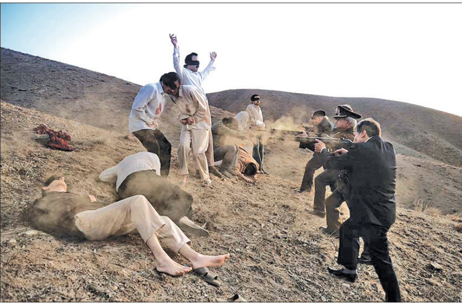
یکسایه‌سازاندر موقعه آزادسازی

کادرهای مخفی حزب بود و طی سال‌های ۱۳۲۹ تا ۱۳۳۲ به فعالیت‌های مخفی سازمانی از یک سو و فعالیت‌های علنی در سطح دانش‌آموزان می‌پرداخت.