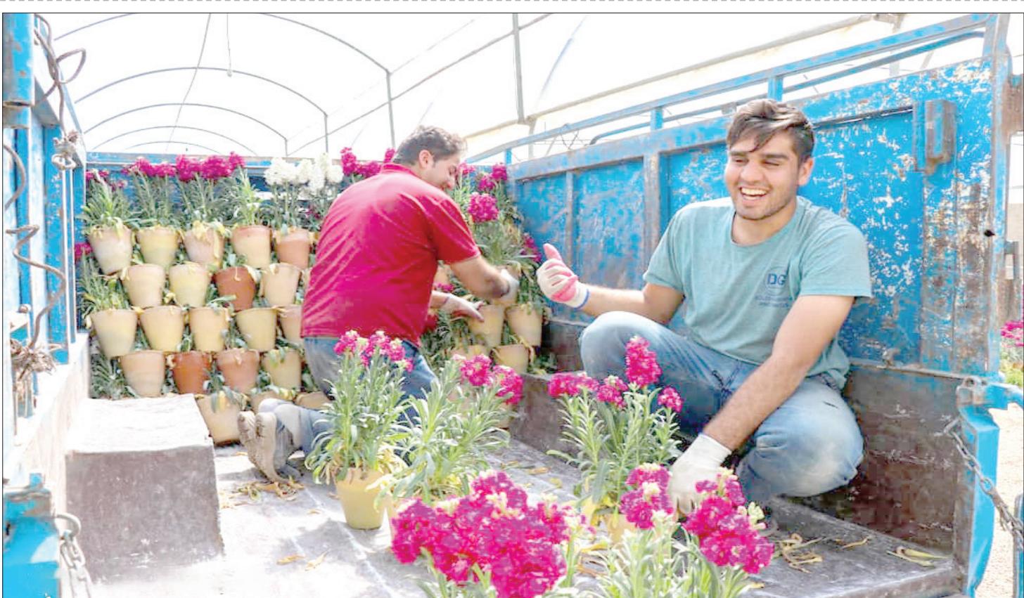
صنای پای بهار